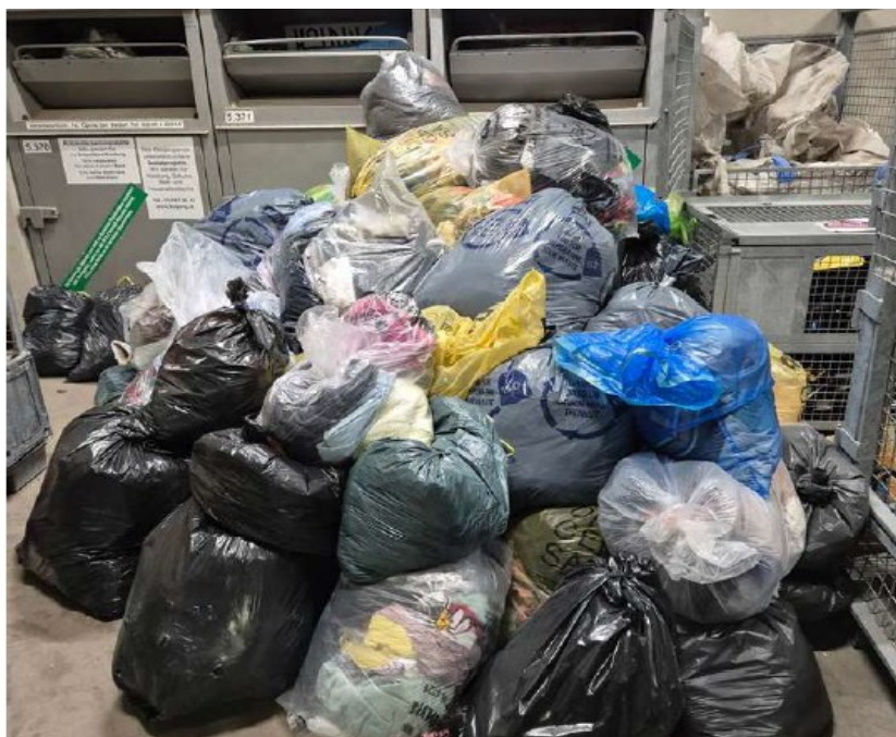
Solche Situationen sollen ab 2026 Geschichte sein - die Sammelmengen von Alttextilien nehmen kontinuierlich zu und überlasten die aktuell zur Verfügung stehende Infrastruktur.

Ab Jänner 2026 bietet der GV Krems den Bürgerinnen und Bürgern im Bezirk Krems drei Wege für die richtige Entsorgung von Alttextilien. So kann bereits zu Hause vorsortiert und damit der richtige Weg eingeschlagen werden. Tragbare Altkleider und Haushaltstextilien, die nicht mehr gefallen oder größtmäßig passen, können mit der ALTKLEIDERSindTRAGBAR®-Schachtel gesammelt werden. Leicht verschmutzte Kleidung, bei der ein Knopf fehlt oder der Reißverschluss kaputt ist, kann in den GV Krems-Alttextiliensack gepackt werden. Schachtel und Sack können in jedem Sammelzentrum im Bezirk Krems abgegeben werden. Stark verschmutzte und verschlissene Textilien wie Stoffetzen finden weiterhin über die Restmülltonne ihren richtigen Entsorgungsweg und liefern damit thermische Energie fürs Fernwärmenetz.